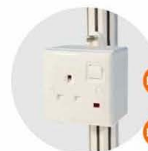
E-12 插座(不能用於照明用電) Single Phase Socket (for machine only) 1000W(220V) E-13 1500W(220V) E-14 2000W(220V) E-15 2500W(220V) E-16 3000W(220V)