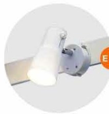
E-01 射燈 (白色) Spotlight (White) 23W