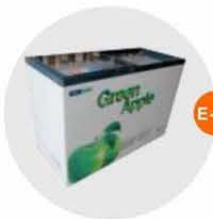
E-11 座地冷凍冰箱 (-18度)(不包括電插座) Sitting Style Refrigerator (-18°c, Excluding Socket) 1.28M(W)x0.57M(D)