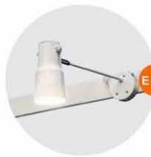
E-02 長臂射燈 (白色) Long-arm Spotlight (White) 23W