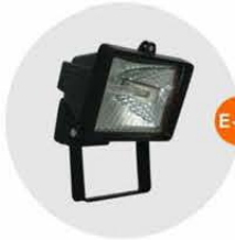
E-05 泛光燈(小太陽) Halogen floodlight 500W