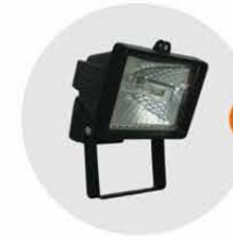
E-04 泛光燈(小太陽) Halogen floodlight 300W