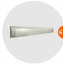
E-03 光管 Fluorescent Tube 28W