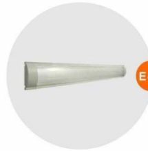
E-03 光管 Fluorescent Tube 28W