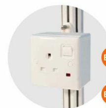
E-12 插座(不能用於照明用電) Single Phase Socket (for machine only) 1000W(220V)