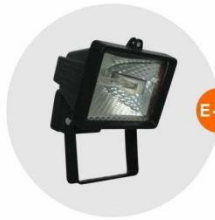
E-05 泛光燈 (小太陽) Halogen floodlight 500W