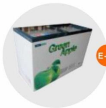
E-11 座地冷凍冰箱 (-18度)(不包括電插座) Sitting Style Refrigerator (-18°C, Excluding Socket) 1.28M(W)x0.57M(D)