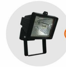
E-04 泛光燈 (小太陽) Halogen floodlight 300W