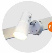
E-01 射燈 (白色) Spotlight (White) 23W