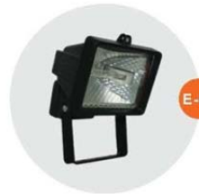
E-04 泛光燈(小太陽) Halogen floodlight 300W