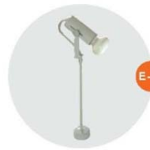
E-02 長臂射燈 (白色) Long-arm Spotlight (White) 100W