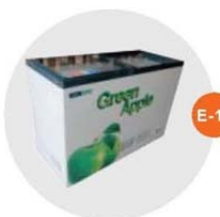
E-11 座地冷凍冰箱 (-18度)(不包括電插座) Sitting Style Refrigerator (-18°c. Excluding Socket) 1.28M(L)x0.57M(W)