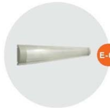
E-03 光管 Fluorescent Tube 40W