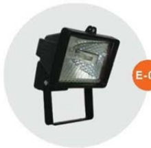
E-05 泛光燈(小太陽) Halogen floodlight 500W