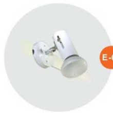
E-01 射燈 (白色) Spotlight (White) 100W