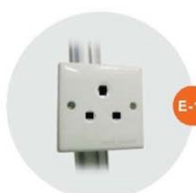
E-12 插座(不能用於照明用電) Single Phase Socket (for machine only) 15AMP/220V(1500W)