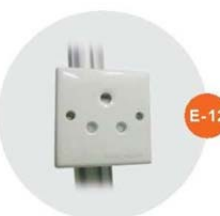
E-12 插座(不能用於照明用電) Single Phase Socket (for machine only) 15AMP/220V(1500W)