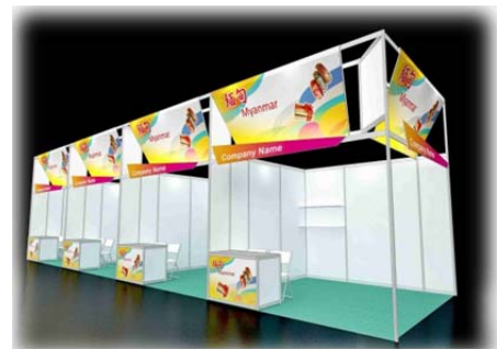
緬甸展區(雙面入口展位)