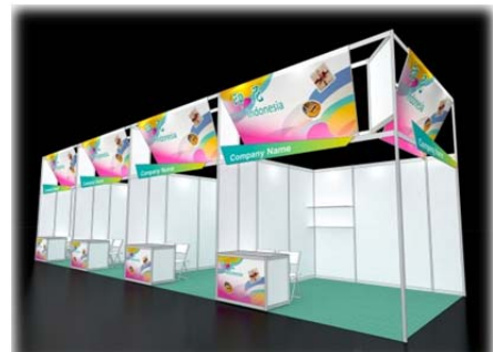
印尼展區(雙面入口展位)