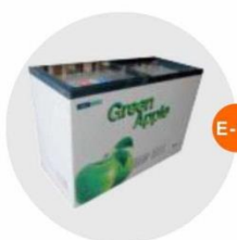
E-11 座地冷凍冰箱 (-18度)(不包括電插座) Sitting Style Refrigerator (-18°C, Excluding Socket) 1.28M(W)x0.57M(D)