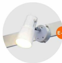
E-01 射燈 (白色) Spotlight (White) 23W