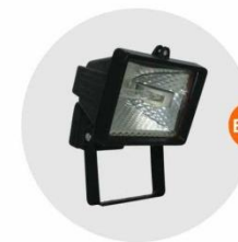
E-04 泛光燈(小太陽) Halogen floodlight 300W