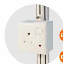
E-12 插座(不能用於照明用電) Single Phase Socket (for machine only) 1000W(220V)