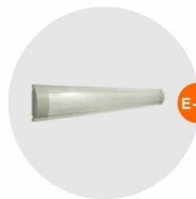
E-03 光管 Fluorescent Tube 28W