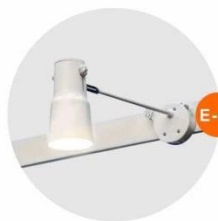
E-02 長臂射燈 (白色) Long-arm Spotlight (White) 23W