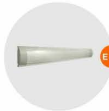
E-03 光管 Fluorescent Tube 28W