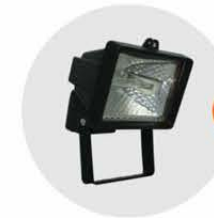
E-04 泛光燈(小太陽) Halogen floodlight 300W