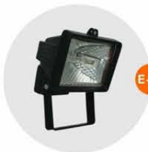
E-05 泛光燈(小太陽) Halogen floodlight 500W