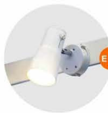
E-01 射燈 (白色) Spotlight (White) 23W