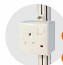
E-12 插座(不能用於照明用電) Single Phase Socket (for machine only) 1000W(220V) E-13 1500W(220V) E-14 2000W(220V) E-15 2500W(220V) E-16 3000W(220V)