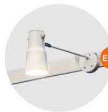
E-02 長臂射燈 (白色) Long-arm Spotlight (White) 23W