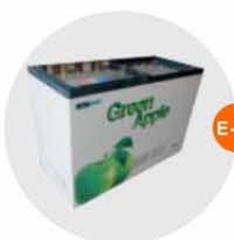
E-11 座地冷凍冰箱 (-18度)(不包括電插座) Sitting Style Refrigerator (-18°C, Excluding Socket) 1.28M(W)x0.57M(D)